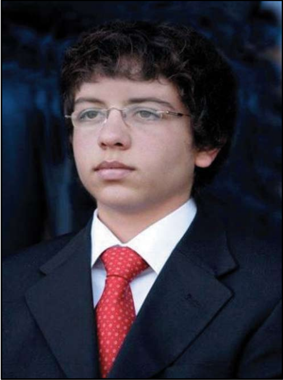
صاحب السمو الملكي الأمير الحسين بن عبد الله الثاني المعظم ولي العهد