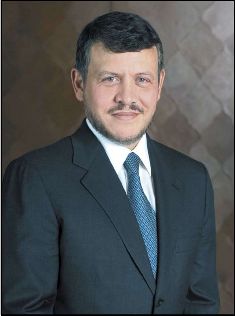
صاحب الجلالة الملك عبد الله الثاني بن الحسين المعظم