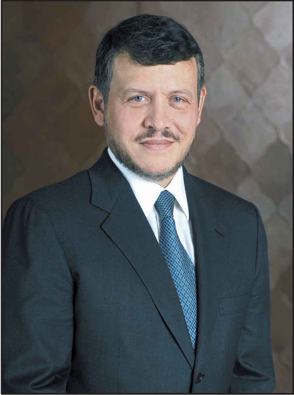
صاحب الجلالة الملك عبد الله الثاني بن الحسين المعظم