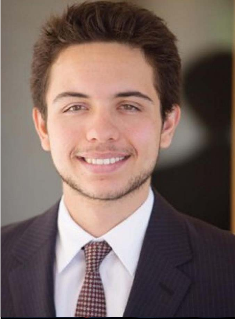
صاحب السمو الملكي الأمير الحسين بن عبد الله الثاني المعظم ولي العهد