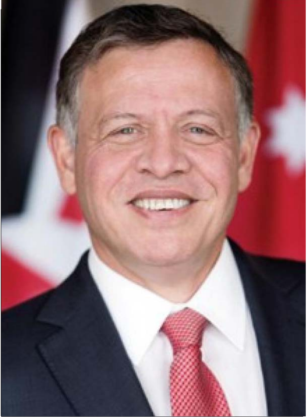
صاحب الجلالة الملك عبد الله الثاني بن الحسين المعظم